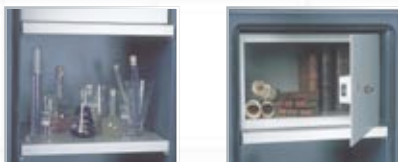
Equipements intérieurs (en partant de la gauche) : tablette, armoire à clé